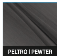
PELTRO | PEWTER